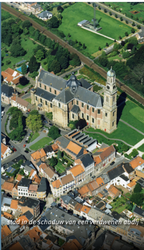
stad in de schaduw van een verdwenen abdij